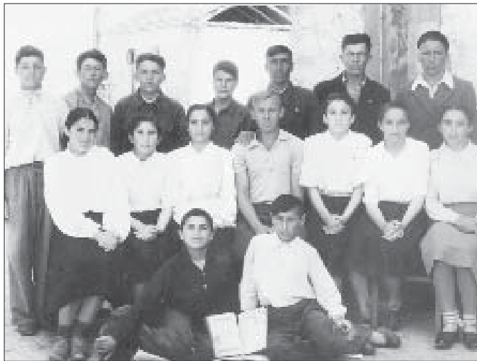
Седьмой класс "А" Шалушкинской средней школы, 1952-1953 уч. год

Отличиться от всех некоторые любят. В колонии осужденный в начале учебного года вдруг заявляет: на уроки русского языка он ходить не будет. «Я грамотный». - «Хорошо, иди к доске». Не хочет. «Чего я там не видел?!» Предлагаю записать предложение... «Еще чего!» - «Что, боишься?» Его как подстегнули. Выбежал к доске. «Давайте ваше предложение!» Даю сложное по построению, намеренно ввожу несколько действительно трудных слов. Записал. Победно смотрит на меня. «На доску смотри, там шесть ошибок». Удивлен, напряженно смотрит. Одну находит. «Это механическая!» С иронией спрашиваю, он, что, трактор или бульдозер, чтобы механические ошибки делать! В классе смехок. «Вот здесь хотел запятую поставить, а может, не надо?» Запятую разрешаю поставить. Правильно. Четыре остальные ошибки помогает найти и исправить весь класс. Смущенный пошел на место. В году он был хорошим учеником...