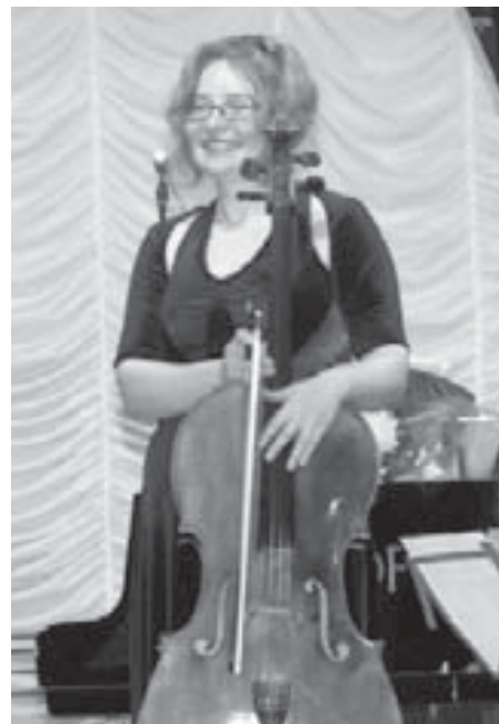
● Материалы полосы Юлии БЕКУЗАРОВОЙ.

- Мои пожелания музыкантам и жителям Нальчика – учить детей классической музыке. Быть может, это единственный путь к пониманию друг друга.