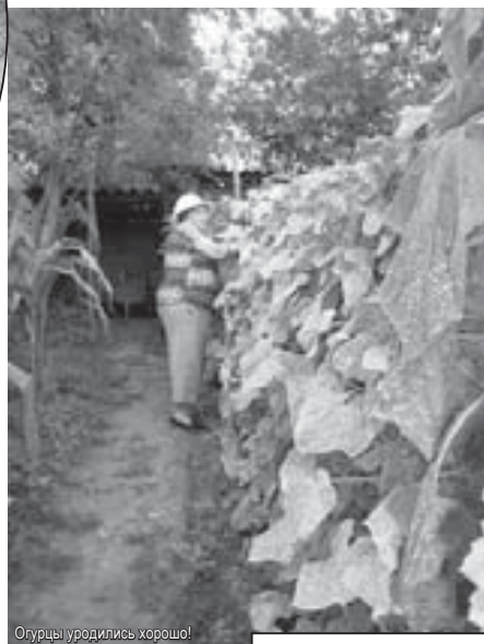
Огурцы уродились хорошо!