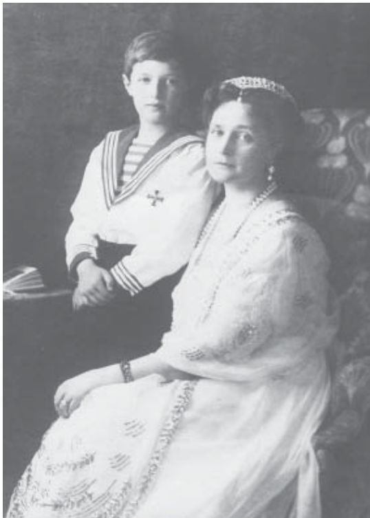
▲ Императрица Александра Федоровна с царевичем Алексеем в Ливадии. Крым, 1911 г.