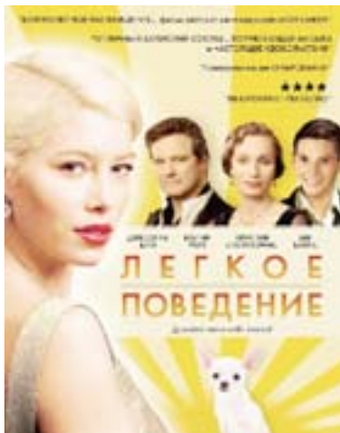
В 2008 году на экраны вышел фильм Стефана ЭЛЛИОТТА «Легкое поведение».

Англия. Двадцатые годы двадцатого века. Фамильное поместье. Истинное английское семейство: сухая чопорная мать, чудаковатый замкнутый отец, взбалмошные дочери, жизнерадостный беззаботный сын и невозмутимый дворецкий. И вот в этом самом семействе появляется очаровательная американка, легкая и непринужденная, она не обременена укоренившимися традициями, ее не приковывают к земле семейные предания. Теперь в этом доме с большими окнами, старинными gobеленами, оранжереями и вечно холодной столовой ветер ее свободы может разрушить порядок, отшлифованный многими поколениями