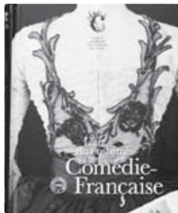
▲ Подарок от Люсетт Кабардинскому госдрамтеатру – книга об истории театрального костюма

на международный фольклорный фестиваль. Мы сразу почувствовали огромную доброжелательность по отношению к себе. Я был также поражен тем, что, практически не зная ничего о нас, выходящих с Кавказа, французы нас с радостью приглашали к себе в дом.