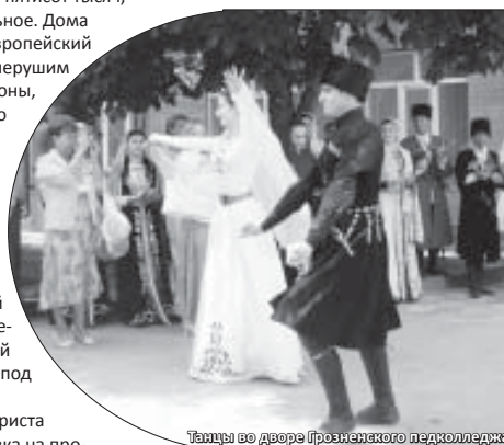
Танцы во дворе Грозненского педколледжа