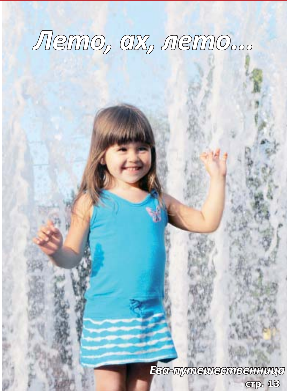
Ева-путешественница стр. 13