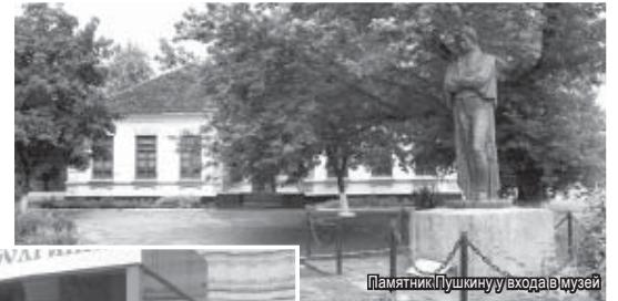
Памятник Пушкину у входа в музей

Кизляр. А линия Моздок – Азов была совершенно открытой, поэтому он и предложил построить десять укрепленных крепостей по этой линии, что и было сделано 235 лет назад. Изначально станица, вернее город Екатериноград был форпостом России на Кавказе. Здесь, у триумфальной арки, брала начало Военно-Грузинская дорога – «восточные врата», связывающие народы и культуры. Здесь побывали СУВОРОВ, ГРИБОЕДОВ, Денис ДАВЫДОВ, поэты-декабристы, ЛЕРМОНТОВ, ПУШКИН, чьим именем назван музей. Кстати, памятник поэту в тени раскидистого дерева создает удивительную атмосферу, словно попадаешь в