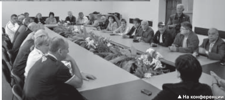
▲ На конференции

В первый день конференции погода, мягко говоря, не баловала: холодный дождь и ветер практически не оставили шансов на запланированный подъем по канатной дороге. Выглянувшее было во время совещания солнце вновь скрылось за дождевыми облаками. Но настроение у гостей не испор-