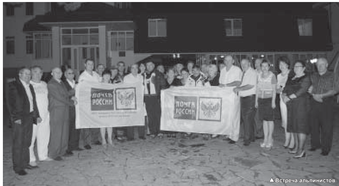
▲ Встреча альпинистов

опасность его передвижения. В почтовых отделениях страны используется система постинга, позволяющая проводить операции с банковскими картами. Разработанная информационная система, позволяющая осуществлять все операции по продвижению товаров народного потребления (наряду