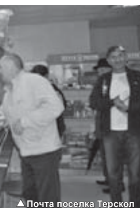
▲ Почта поселка Терскол

● Юлия БЕКУЗАРОВА.