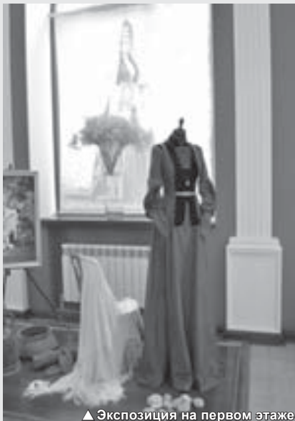
▲ Экспозиция на первом этаже

шлого: наши прабабушки, их сестры и подруги. Все эти знаки повседневности помогают нам понять систему представлений о прекрасном, в которой жили наши предки: красивым считалось не только то, что соответствовало каким-то эталонам