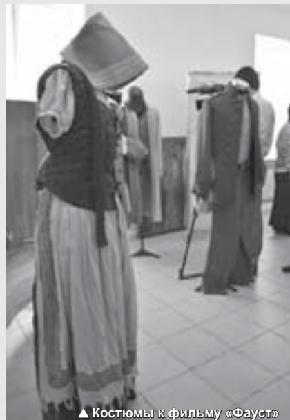
▲ Костюмы к фильму «Фауст»

ем новых технологий. Как рассказал «Горянке» Александр Романов, повышению качества единой услуги Интернет способствует проведение Министерством связи РФ конкурсов, которые ФГУП «Почта России» выигрывает. По всей стране внедряется контроль транспорта системой GPS, позволяющей обеспечивать без-