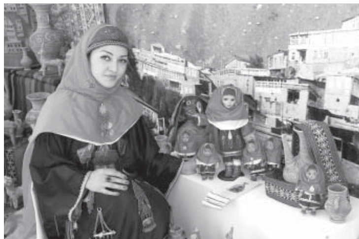
▲ Дагестанское подворье