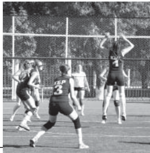
▼ Волейбольная команда КБР

и в Кизляре, а инкрустируют серебром и золотом в поселке Кубачи, от которого и пошло название «кубачинское оружие». Настоящим сюрпризом для всех стало выступление лакского канатоходца – еще один бренд Дагестана, прочно связанный