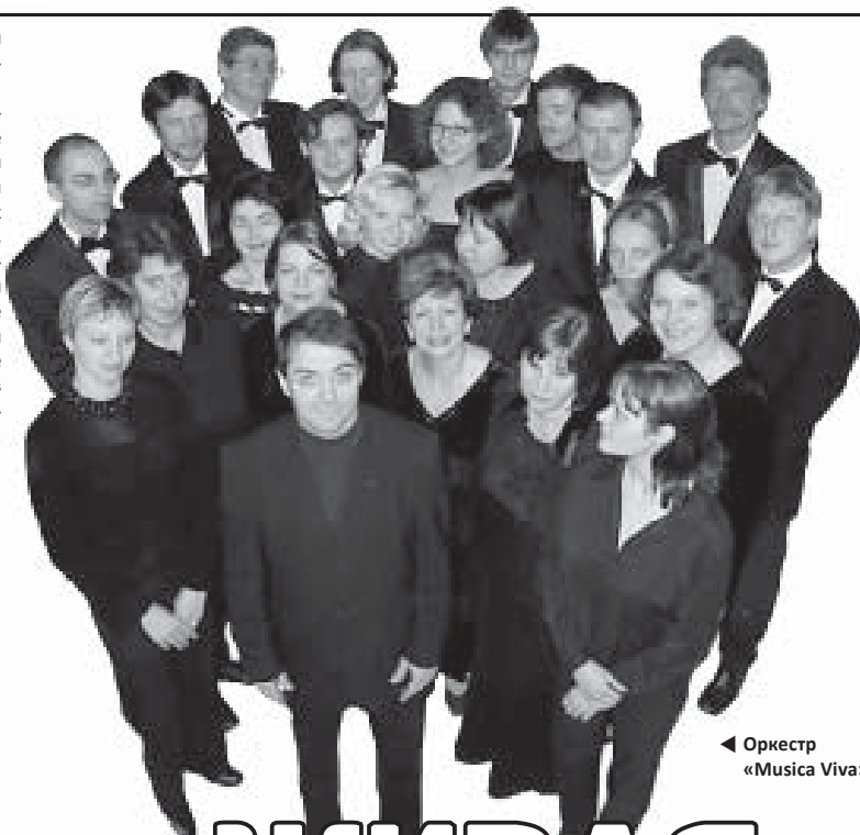
◀ Оркестр «Musica Viva»

В Нальчике открылся первый фестиваль симфонической музыки имени маэстро Юрия ТЕМИРКАНОВА. Проект осуществляется при поддержке министерств культуры РФ и КБР. Жителей и гостей столицы ожидает серия концертов самых выдающихся оркестров страны, а также знакомство с известными исполнителями. Первой ласточкой стало выступление московского оркестра камерной музыки «Musica Viva», которое состоялось на прошлой неделе в Государственном киноконцертном зале «Форум».