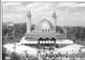
Во имя Аллаха Милостивого и Милосердного!

Хвала Аллаху, Господу миров, мир всем Его посланникам, мир, милость и благословение Всевышнего Аллаха да пребудут с вами, дорогие братья и сестры по вере и дороге наши соотечественники!