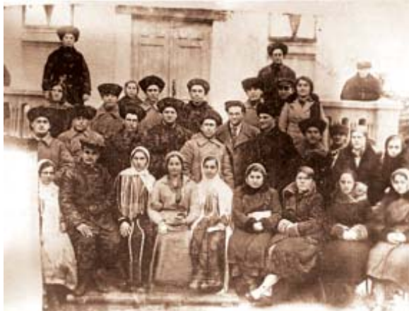
▲ Участники областного совещания стахановцев сельского хозяйства, 1935 год