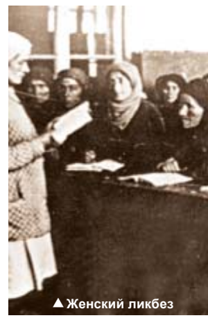
▲ Женский ликбез

Женское движение всячески поощрялось политическими организациями и прежде всего комсомольскими ячейками, где преобладали мужчины.