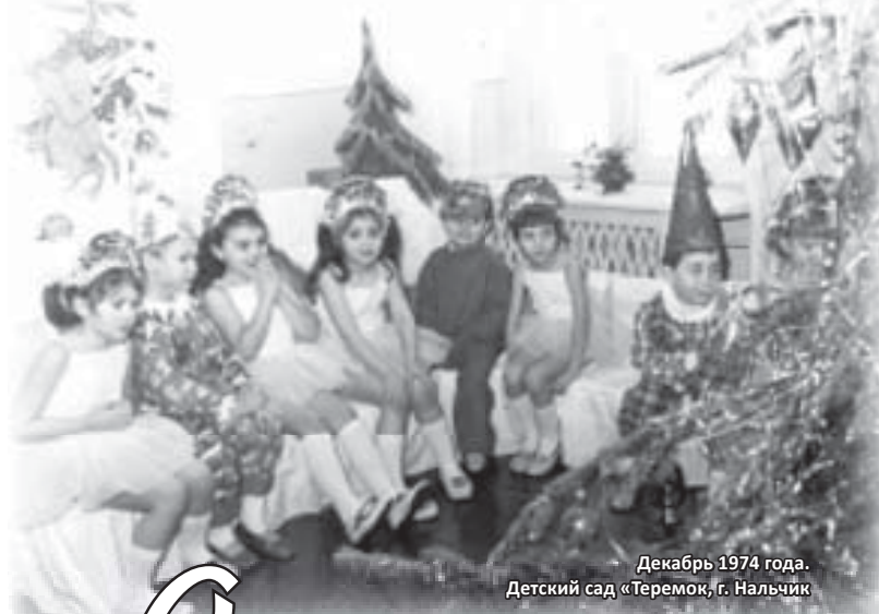
Декабрь 1974 года. Детский сад «Теремок», г. Нальчик

И эти волшебные, наполненные радостью события происходили. Иногда даже по несколько раз в день. Праздник для нас наступал обычно в конце двадцатых чисел декабря. В детском саду все было готово к новогоднему утреннику. Елка была празднично убрана дорогими и очень красивыми гдээрвскими игрушками. Снежинки, которые мы всей группой накануне вырезали из салфеток, были развешаны воспитательницами под потолком. На стенах были расклеены казавшиеся нам гигантскими цветные, по-моему, васнецовские иллюстрации к русским народным сказкам. Сами мы тоже были готовы. Всю неделю до этого, а может быть, и больше под бдительным руководством наших воспитательниц – святых и мегер репетировали представление. Новогодние костюмы, в которых мы должны были умирлять своих родителей в ходе утренника, добывались едва ли не контрабандным путем. Часть из них изготавливалась мамами и бабушками, часть заказывалась в ателье. Вскладчину был заказан фотограф. Помню, как он бродил где-то в «кулуарах», обвешан-