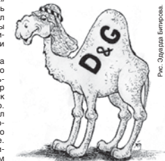
Рис. Светлана Вертокина