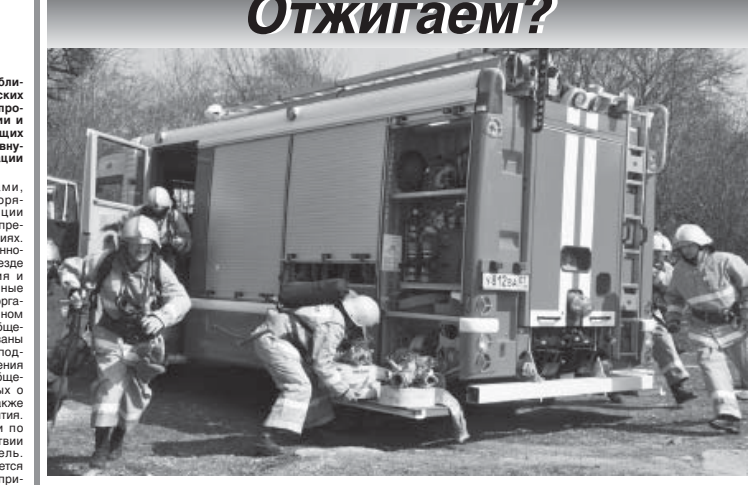
О пожарах сейчас много пишут и говорят. Причиной возгорания могут быть самые разные, но в большинстве случаев виноваты мы сами. Редкие исключения лишь подтверждайте общее правило.

Российские органы предотвратят наказания как за уничтоженную, так и за непреднамеренную порчу имущества. Это касается и пожаров. Нарушение требований пожарной безопасности, повлекшее причинение тяжкого вреда здоровью, может обернуться штрафом до восьми тысяч рублей, принудительными работами или лишением свободы сроком до трех лет. В соответствии с Федеральным законом «Об охране окружающей среды» Правительство КБР постановило: 1. Утвердить определенный порядок действий по предотвращению возникновения пожарной опасности в Кабардино-Балкарской Республике.