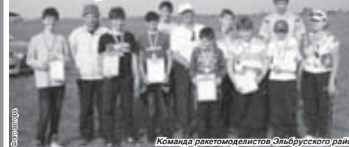
Команда ракетомоделлистов Эльбурского района

Недавно в Нарткале состоялся республиканские соревнования по ракетному моделизму среди учащихся.