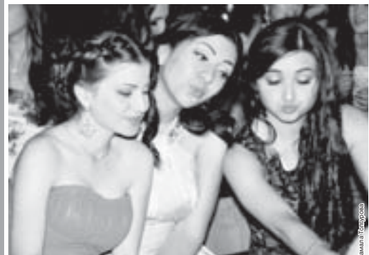
Слева направо: организаторы бала школы №18 отметили специальные номинации. По ковровой дорожке, обрамленной сверкающими гирляндами, дефилировали юные, красивые и уже свободные от школьных обязанностей «Мистер талант» и «Настоящий джентльмен». «Настоящая девушка» и «Всегда в режиме онлайн», «Золотой десант» и «Фотомодель».

Покладующую школу молодости организаторы бала школе №18 отметили специальными номинациями. По ковровой дорожке, обрамленной сверкающими гирляндами, дефилировали юные, красивые и уже свободные от школьных обязанностей «Мистер талант» и «Настоящий джентльмен». «Настоящая девушка» и «Всегда в режиме онлайн», «Золотой десант» и «Фотомодель».