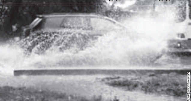
Это не котер, а автомобиль после дождя в Нальчике