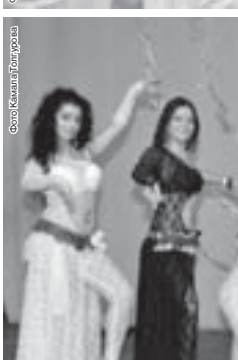
Коллектив «Хати» (Владикавказ)

Волна восточной экзотики накрыла государственный киноконцертный зал минувшие выходные. И на сцене, и в зрительном зале искрились умопомрачительные наряды, звучала зажигательная восточная музыка. И, глядя на все это великолепие, хотелось жить, как танцевать, а танцевать, как жить, — легко, плавно и загадочно.