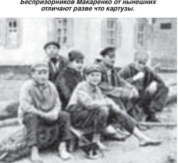
Беспризорников Макаренко от нынешних отличают разве что карты.

Я убеждена, что в наше время нужны абсолютно радикальные методы работы с беспризорниками. Возможно, такие меры не вписываются в современные каноны воспитания. Людьми путями, но детей нужно «забрать» с улиц и насильственно социализировать, как это было в первые годы совет-