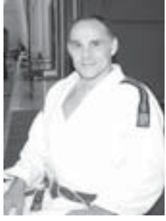
Подготовил Альберт ДЫШЕКОВ