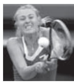
Грыжа, меня экстренно госпитализировали и провели операцию...