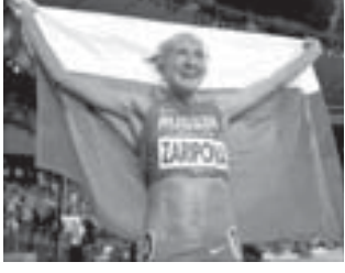
Подготовил Альберт ДЫШЕКОВ

В остальных видах спорта россияне продолжают выступать с переменным успехом.