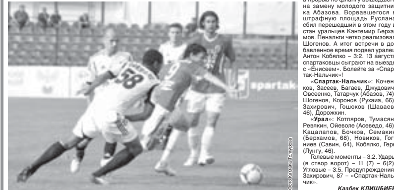
События на поле

Во-первых, мы брали Марата как лидера. Он должен быть лидером, но должно быть по-другому. Ему Вовшенин дано играть и играть очень хорошо.