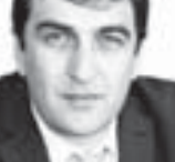
Чего удалось достичь в этом направлении?

Еще один пункт программы - диспансеризация 14-летних. В течение двух лет диспансеризацию должны пройти 2345 подростков, и на это выделено 29 млн. 413 тыс. рублей. Уже прошли диспансеризацию 14052 человека (60 процентов). Зарегистрировано 2612 заболеваний, из них впервые выявлено 1259, под диспансерное наблюдение взяли 1117 детей.