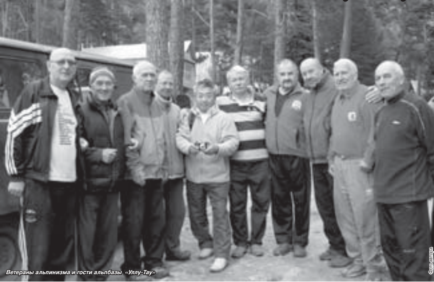
Ветераны альпинизма и гости альпбазы «Улу-Тау»