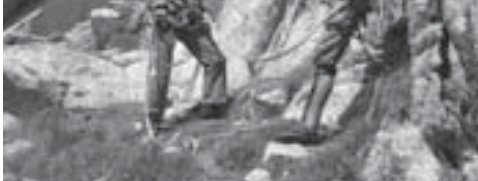
Во время соревнований по скалолазанию

горных районов Кавказа, где возвышаются такие привлекающие внимание вершины, как Улуту-чана (4207 м), Джайлык (4533 м), Топо-Башы (4490 м) и другие. Через три года было построено одноэтажное здание учебной части с библиотекой и столовой. Тогда альплагерь получил название «Азот». Его история примечательна тем, что в первый год Великой Отечественной войны здесь велась подготовка бойцов Красной армии для ведения боевых действий в горах. Возрождение альплагеря произошло уже после войны, и он получил новое название – «Химик». А в 1958 году были построены двухэтажный главный корпус на сто метров со столовой и клубом, два павильона на 55 мест каждая. Строить в условиях горного ущелья, где не было прямой автодороги, оказалось очень непростым делом. Но это стоило того: с тех пор альпинистская учебно-спортивная база, получившая в дальнейшем название «Улу-Тау», исправно служит людям. За годы существования в ней подготовлена не одна тысяча альпинистов-разрядников. Среди них есть такие, которые, придя в горах Кавказа хорошую подготовку, затем покорили вершины-восемьтысячники, стали мастерами спорта международного класса. И сегодня под руководством инструктора альпинизма первой категории, почетного мастера спорта Юрия Ивановича Поляничкина, проработавшего здесь уже полвека и выполняющего обязанности начальника учебной части, проводится подготовка и повышение квалификации горноспасателей. Добрых слов