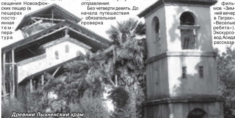
Древний Лыхненский храм