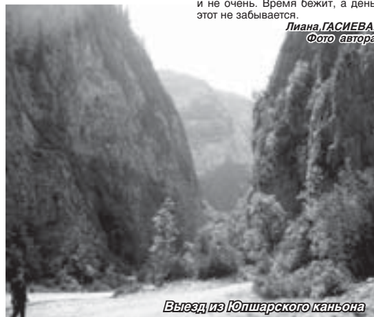
Выезд из Юпшарского каньона