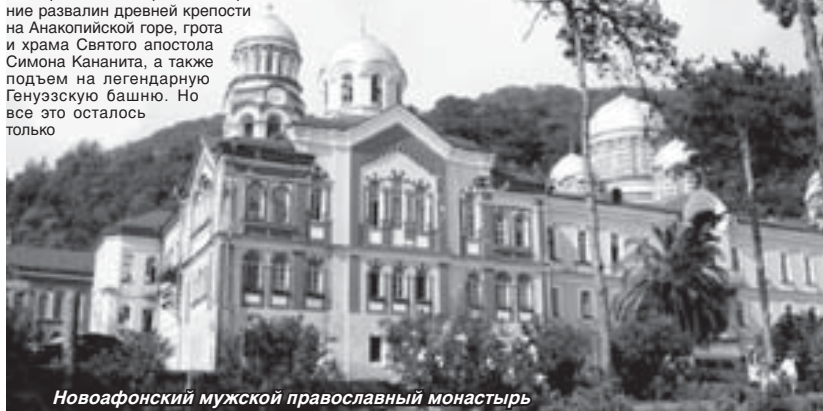
Новоафонский мужской православный монастырь