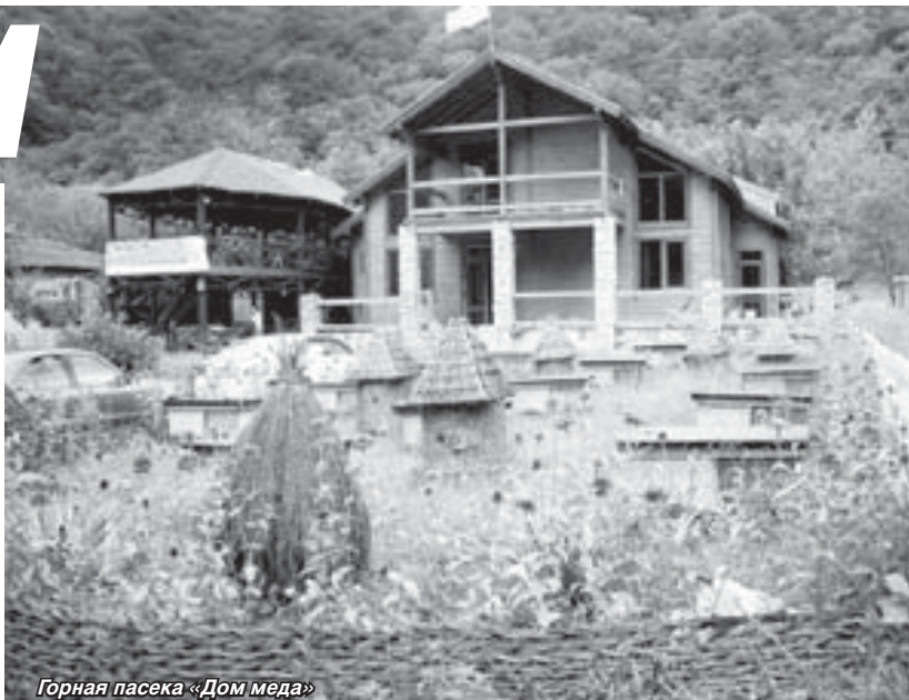
Горная пасека «Дом меда»

Еще было обещано посещение развалин древней крепости на Анакопийской горе, грота и храма Святого апостола Симона Кананита, а также подъем на легендарную Генуэзскую башню. Но все это осталось только