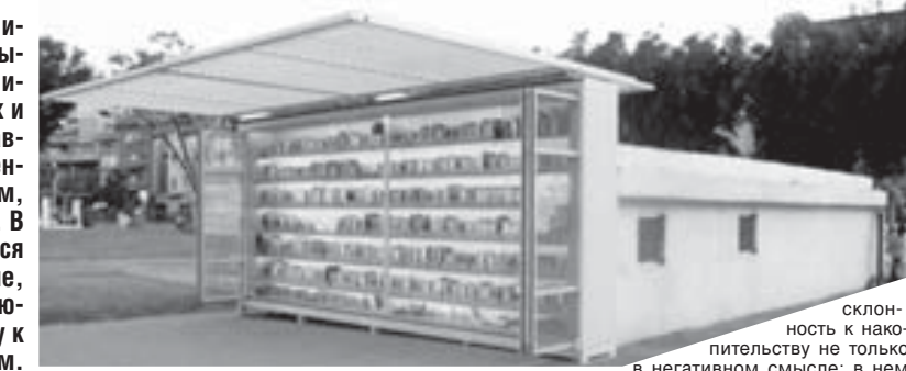
Склонность к накопительству не только

Надо согласиться и с теми, кто считает: книга компьютер не мешает. Но найдите того, кто пожертвует, положив на уличную