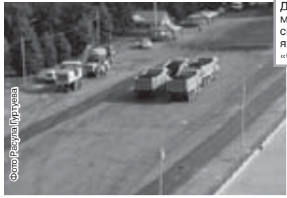
Особо Рагула Гуртуева

В столице республики завершаются подготовительные работы к открытию фестиваля «Кавказские игры-2012». Основные мероприятия будут сосредоточены вокруг стадиона «Спартак», на площади Абхазии и в Универсальном спортивном комплексе, сейчас они в ударном темпе приводятся в праздничный вид.