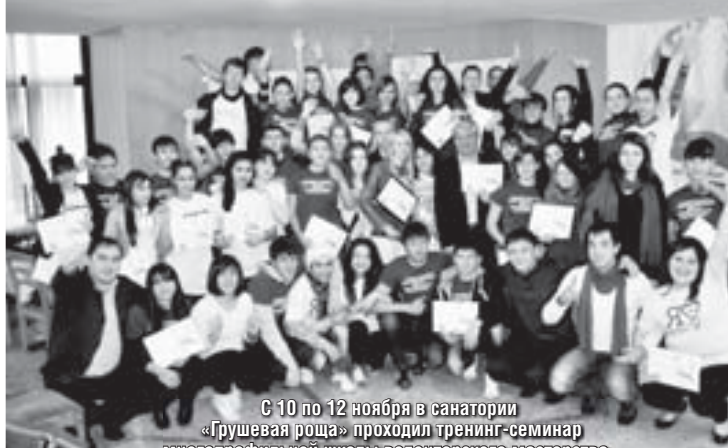
С 10 по 12 ноября в санатории «Грушевая роща» проходил тренинг-семинар многопрофильной школы волонтерского мастерства.