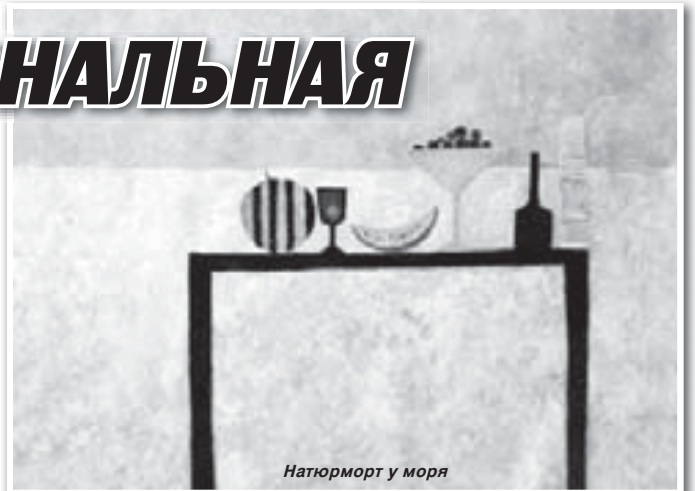
Натюрморт у моря