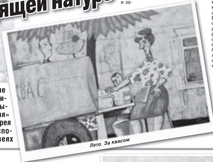
Лето. За квасом