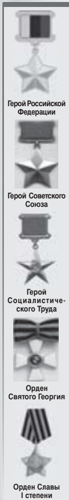
Герой Российской Федерации

Эту дату отмечают в России с 2007 года. Отправной точкой для ее определения стало учреждение российской императрицей Екатериной II в 1769 году высшей воинской награды страны – ордена Святого Великомученика и Победоносца Георгия. Сейчас в этот день чествуют кавалеров ордена Славы и Святого Георгия, Героев Российской Федерации, Героев Советского Союза, Героев Социалистического Труда.