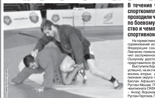
Материалы рубрики подготовили спортивный обозреватель Альберт ДЫШЕКОВ и Анатолий ПЕТРОВ

В течение четырех дней в спорткомплексе «Нальчик» проходили чемпионат СКФО по боевому самбо, первенство и чемпионат округа по спортивному самбо.