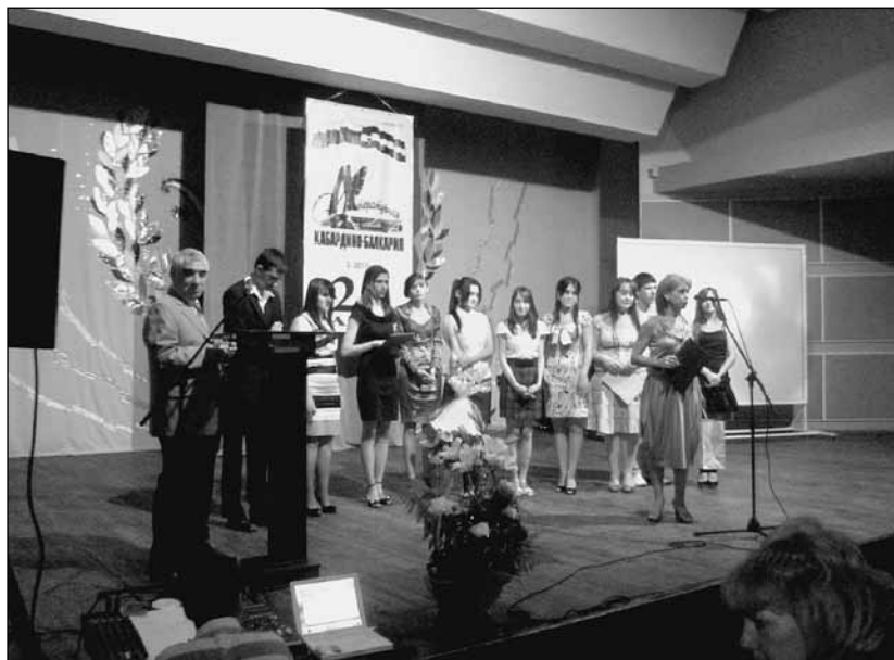
Литературная студия «Свеча» поздравляет журнал с 20-летием. Июнь, 2011 г.

А своему «альма-мáтер» (лат. alma mater , букв. «кормящая, благотельная мать») – центру развития творчества детей и юношества, родному коллективу желаю продолжать идти дальше в ногу со временем!