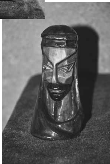
Сурагланы басмагъа Мамайланы Алий хазырлагъанды