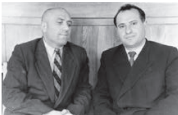
Къайсын Жанакъайыт бла