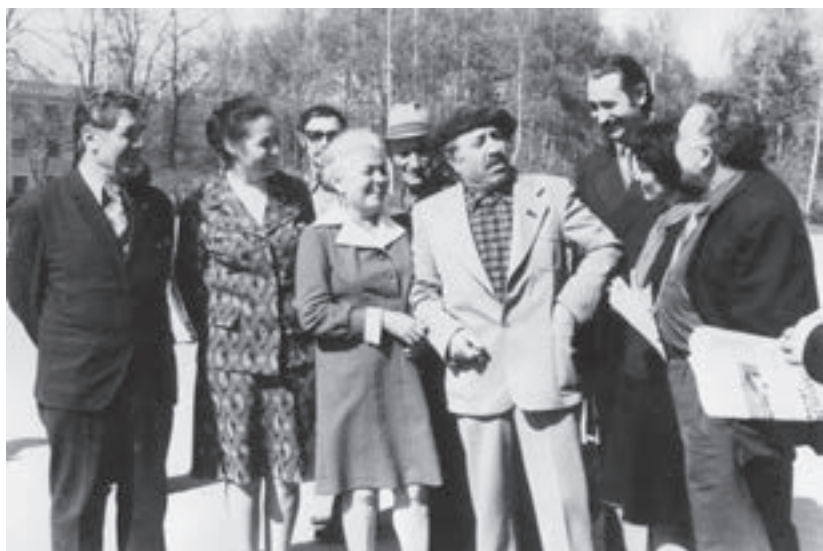
Къайсын актерла бла ушакъ бардырады