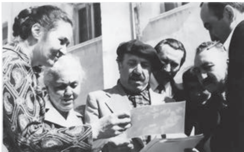
Къайсын театрда къонакъда