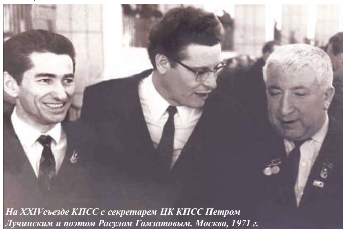
На XXIV съезде КПСС с секретарем ЦК КПСС Петром Луцинским и поэтом Расулом Гамзатовым. Москва, 1971 г.

В 1971-м Зумакулова избирают первым заместителем председателя Веселозной пионерской организации, одновременно он заведует отделом ЦК ВЛКСМ (и находит силы и время для защиты кандидатской диссертации). Это было время настоящего расцвета пионерской организации, к тому же следующий, 1972 год был юбилейным