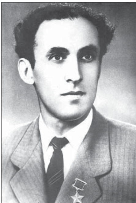
дашеуэнур. Абдежым ахэр идубыдэншц.

Ротэр, пшэдджыжым шцэзуа шцыплэмкэ йоклуэтыжри, бийм потыс. Хьурегъагыр ирашцкыну езырыеклуэу машинэхэр къоблагъэ. Иуаным унафэ ешц: «Къэсына нэужькылэц абыхэм