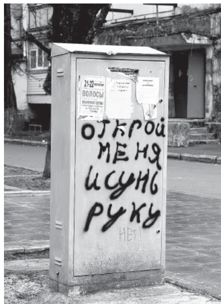
Некоторые жители нашего замечательного города общаются между собой через особые виды связи. Хорошо, что те, кто отвечает, знает, что не всем советам надо следовать. «Нет!» – твердо говорит анонимный собеседник.

Мне казалось, что моя любовь уже прошла. Слишком все стало обыденно, скучно. Я знаю о нем все, знаю его друзей, что он любит пить, и где любит есть. Его собаку выгуливаю я, а лекарства для его матери мы покупаем вдвоем. Мы постоянно вместе. И мне казалось, что-то незаметно ушло. Я старалась цепляться за прошлое, те воспоминания, которые мне приходят на ум, когда я начинаю думать о нас. И я думаю постоянно. Понимала, что этого недостаточно. Но я не могла его просто так отпустить, все-таки мы встречаемся уже пятый год. О том, чтобы создать семью, мы не говорили никогда. Это казалось само собой разумеющимся. Но недавно что-то изменилось. Наши отношения стали выходить из обыденности, не знаю как, но это произошло. Я смотрю на него и вижу другого человека, изменившегося, более уверенного в себе, подтянутого, симпатичного, с этой улыбкой, которая может растопить лед. Я так люблю его и так рада, что мое чувство вновь стало расцветать. Но мне так хочется докопаться до причины этого. Я ему тоже сказала об этом, но он ответил, что не чувствует изменений, что он меня и так любит, так же сильно, как и прежде. Но я не могу настолько ошибаться. Может, это просто потому, что я чувствую приближение весны? Я очень люблю весну, она моя спасительница во всех отношениях. Даже несмотря на то, что вокруг столько снега, чувствую этот запах, и мне хочется любить больше и больше. Хочу поздравить всех читателей вашей газеты с наступлением весны и пожелать любви. Ведь это самое главное.