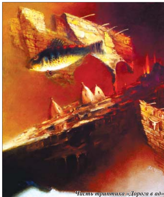
Часть триптиха «Дорога в ад»