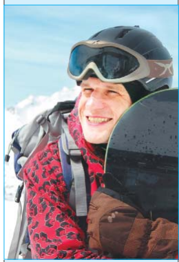
«ВЫСОКОГОРНОЕ НАСТРОЕНИЕ»

Конкурс продлится до конца 2012 года, а фото победителя украсит первую страницу одного из новогодних выпусков «СМ».