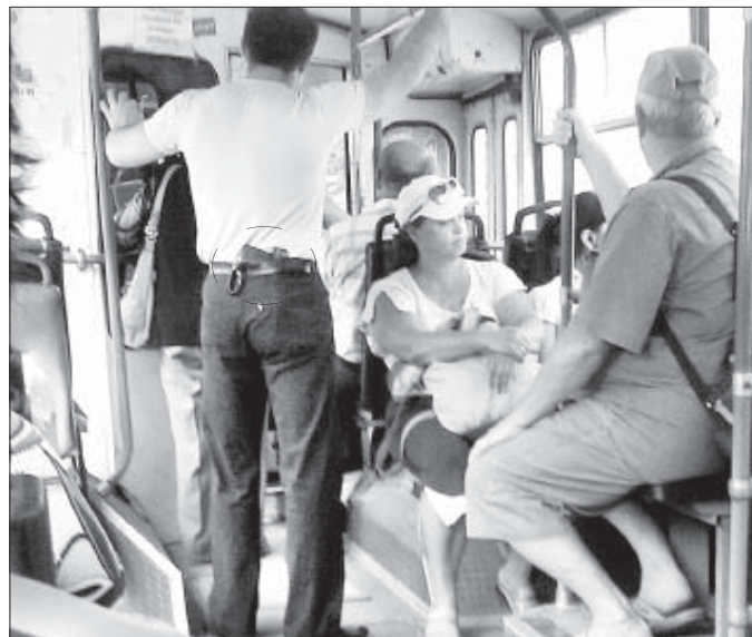
Я увидела этого мужчину в троллейбусе. Все в шоке смотрели на то, что у него торчало за спиной. Смотрите сами, разве так можно ездить в общественном транспорте?