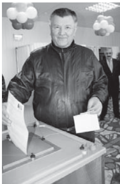
Ахыры 2-чи бетдеди.

Бек башы уа - кѣралда, республиканы да тынчылыкъ, ырахатлыкъ болурун илейбиз. Ала болсага, экономика да кѣчлерин, биз биригип, жангы жашауну кѣууарга керѳбиз. Аны ючюн кѣл кѣторюргем.