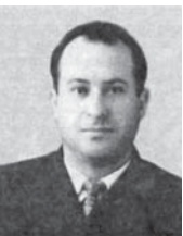
Залиханлы Жюносно жашы Жанакаит

На Кавказе балкарцы веками растити зерно, можно сказать, прямо на склоне холма, под ногами пропастей, дна которых не видно, действительно, трудился, как муравьи. Мой маленький народ считался не только одним из самых трудолюбивых,