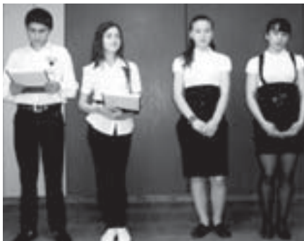
Ингире кытышкан окуучула.

Улуу Ата Журт уруш башланганда, Отар улу ары кесини ыргызды да кетгенди. Ислам бля Луиза аы, халпарлары андан ары бардыра, пост оп жылда аскерчилиги жигиттикке