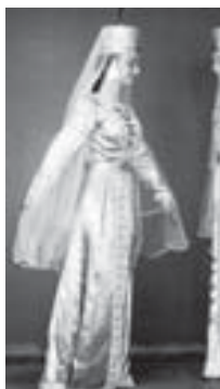
Црайланы Инзиля бля Малика Камолова төпөлдө.

САРАКЮЛПАНЫ Асият. Сурагылары автор алганды.