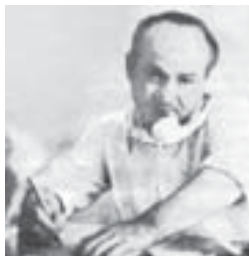
муратны жаргы» (малкыр тилде), «В дни войны и мира» (орус тилде) деген кытылары чыккандыла.

Инигр, Темукюланы Карина пинаниодо согул, Керимн сёзлөрине жазылган жырны айтып башлан-