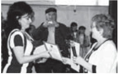
Муускаланы Сакинат Толгурованы Пишжанны саугалады.

Гитче окуучула ишленген суратта, аяны жомактары, нэмчуктары отуз жылы ичинде «Нор» сабий журналы бертеринде чыгадыла. Бу басма ашык төрөлөг кеп телюно юйрөгтенди.