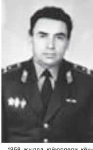
1958 жылда юйорлери көчүрчөлөкөндөн тургун журтка кыйтанлай Терк эл молк техникумга киргенди. Андан сора «Чирик Көл» холхозда мал доктор болуп ишленгенди.

Жаз башыны бу аруу эм куулатын көлөринде биз Баширдын Абдрахманны жашы Анатолий бля аны 70-жылгыгына кызыл жорек көтөрүлөпкөндө белгилер эдик. Алай, не медет, кыадр алай бурмады. Аны тангыяланы, аны жуурук адамаланы эскеринде болмай тургандай өлкөм аны бизден айырды.