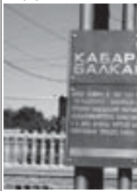
Эли орамлырныдан бири.