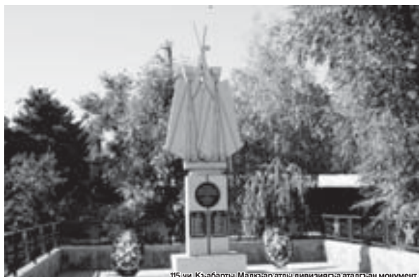
115-чи Къабарты-Малкъар атлы дивизияга аталгъан монумент.