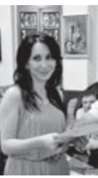
Таппасханяны Аминатны диплом бла сауғалайдыла.

күлүкчүлару, муниципаль-ный кыуалуаны администрацияларны келечилери көлгөндиле. Эшта, бу байрамын кыуатна арга аллай бир адам келер деп сакялы болмас эдиле, гитчерек залны да андан сайлаган болура. Алай анга аладан келгинлик тилегенди. Алай адаманы келгюнч ити шартта да санаганды. «Биогендик барыбыз да бир бирге былай жуукк отуруп, бир бирибизни алгышлаганыбызны не багыса барды», - дегенди. Андан ары ол союзу биринчи таматарларын уллу хурмет