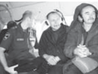
Арт кезюде ол, кѳл толуп, суу оюкъыннып, ырхы Тирныаузгъа хата келтирди деп кѳп халар жорюйдо. Ала байламлыды Бийик тау геофизика институту, МЧС-ини келечилерин да къайгыр-

Къабарты-Малкъарда жашаган адамланы къыйын табыгъат болумладан къоруулау, суу кѳтюрюлюу бла байламлы гидрология болумуну тинтир мурадта Российни МЧС-ини Къабарты-Малкъарда Баш управленийсы, баскак организацияла бла ведомстволаны келечилерини къатышуулары бла республиканы бийик тау районларын вертолѳт бла тинти чыкъгъанды. Кюн къызуу болуп, арадан арагъа уа сакъ журула жаууп тургъанлары себѳеми тау элде дѳрхѳ кѳлѳр, жер кѳчер деген гузаба сакъланады. Табыгъат болумлағъа кюн сайын уллу эс буруп турулмаса, хал осалгъа айланп, адамла къыйынлыкъларга тошлѳре деп къоркъадыла спецалисттер. Кѳп болма ала вертолѳт бла чыранлағъа къарагъандыла. Аслам эс Басхан аууунда Башкъар кѳлге бурулгъанды.