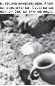
Бизни тейредө саутта көп санда табылды.

«Летопись в камне» деген циклин кыраачай: «Биз кез алда турган затпаны көргөзтөбүз. Бу эгертмелени ичинде биз тууганын бери жашап турабыз, алай болганыкыга, анга эс бурмайбыз», - дейдиле. Муну алында чыкьсан эки фильм да бусугатдагы Кыраачай-