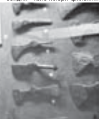
ГЕРИЛИЛАНЫ АСИЯТ. Суратпаны МАМАИЛАНЫ Алай алгьанды.

Тюнегити кюнөн билмелени тамбасы жокчуу бусугатда жашаган тейлө уа тарыхларында аны бля айрылганды. Археолог ол жер тобюндөн политикле ары сукьган шартпаны кызаип чыгардыла. Презентацияны ахырында залга жыйылганы битеу ол затпаны чертгенди. Мындан арзында «Эльбрусиди» келечилери фильмин