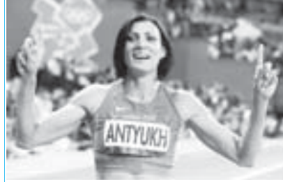
Ахыры 2-чи бетгедеи.

Россейли спортчула тёрт майдад къытхандыла. «Алтынны» жан «кюмошю» оюнлада 8-чи августта 16 комплект майдад ючюн эришюле бардырылгьандыла.