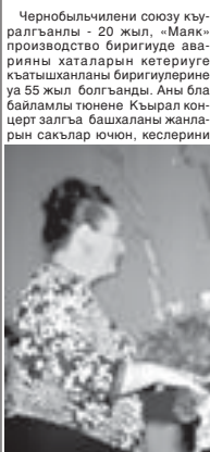
саулукчыларын, жашауларын окуяна аймагъан жигите жыйылгъанды.

Алагъа бек алгъа Эпрус районда жашагъанла чернобыльчиле кыалай журмет этгенлери, даржаларын уллу кетерилени юсюнде видеофильм кюргюзюлоди. Техногенный кыйынлыклары кетериге кыатышкан заманда эмда арда ол кезиуде талкан ауудан өлгенле эсертме республикада жаланда Тырыну ауу шахарда сюелди. Анга, шюкчула, шахарчыла да жюрюк, голле саладыла, тизгинни жардыла. Шахары 5-чи номерли орта шюкчуда да жигитлени атлары унутулмазча кеп торлю мадарла этиледиле: чернобыльчиле бля тобешуиле, эсертюно кюнери, дагыда кеп башка ишле бардырыладыла.