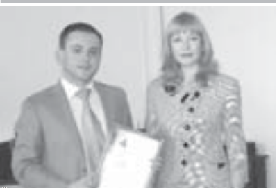
Езденданы Расууну алгышылган кезиу.