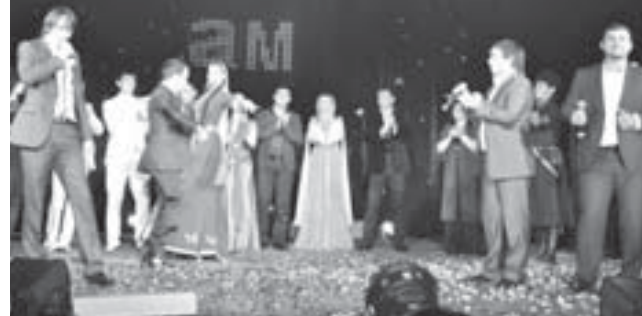
Концерте кыатышканданы кыууму

Энди дин байрамлага жоралып, кырачайлы, малкыарлы жырчыла да биригип, концерт көргөзкөчүри иги төгө айланганды. 30-чү