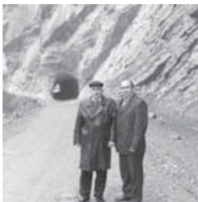
Дюгер тарындагы туннель Черек тарындагына бек ушайды.

озуп, Дюгерге жетбиз. Тешиню толю жолла бля бара, биринчи Лескенден этгенден сора, Толзун деген элзирине келбиз. Ол артык улпу жер тийди. Мында муслиманна, христианды да жашайдыла. Эсенден эсе тешю кендо. Таула, кыяла уа алыкка кыронеймде.