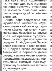
Ахыры 2-чи беттеди.