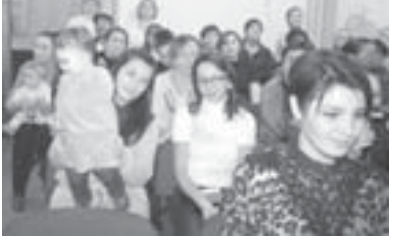
Сабийле сахнада оюн кѐргѐткен кезинде.

Ма алыны юретиру, хар зат бла да кѐчидируу башка сабий