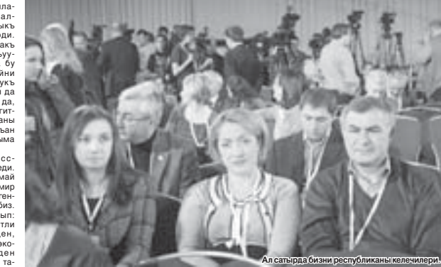
Ал сагъарда бизни республиканы келечилери!

Сиз, багъалы окъучуларыбыз, аланы асламысыны юслеринден кесигиз да эслеген, оштан болгъуз, мен а тюрлю-тюрлю кёргозюпмеген шарт-