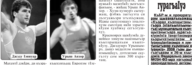
Махунт дэбри, ди кыра-лен чыкыры эдэш медаль кылуунынх Европым Түүнэйр и чемпион Урыш Анзор.