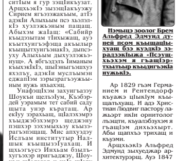
Брем Альфред Эдмунд.

Брем Альфред Эдмунд. Архызкэ и нэфыр зыкыфлэщыжыныгъэм лъагъомыхуныгъэ къешэ.