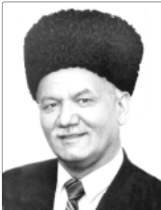
Алыхьым псэ хьэлэлэ хуэлажэ Бэлагы Шоукы.

Алыхьым псэ хьэлэлэ хуэлажэ Бэлагы Шоукы. Архызкэ и нэфыр зыкыфлэщыжыныгъэм лъагъомыхуныгъэ къешэ.