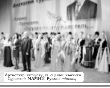
Артистхэр зэгъусэу зэ сценэм къыхъэж.