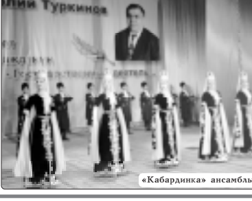
«Кабардинка» ансамбль кьофа.