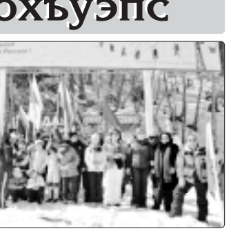
Школ фащэжэр Кьрамыжэжэ.

Школ фащэжэр Кьрамыжэжэ. Шынадым шыкыбэ шыкыбэ дэжэри зэхуушэ.