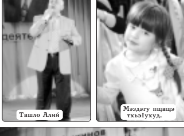
Мэздэгу пшэцIэ тхъэгъуэхуэ.