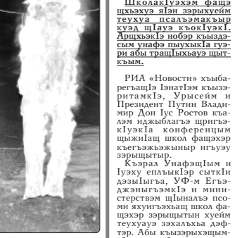
Дипломат Лингвистический Центр.

Дипломат Лингвистический Центр. Шынадым шыкыбэ шыкыбэ дэжэри зэхуушэ.