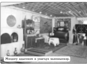
Мэздэгу адыгэхэм я унагъуэ хьащыпхэр.

Гуэхур къыщыцIадазщ Тьркуиныр къыдзыхъуэ цыпIэм, ар щеджа школым. Серноводск кьуажэм и курыт еджапIэм и пIантIэр нып къызэрхъуэхэм, уагъ гъуэ хэмкIэ гъэцIэрэщIат. ХьэцIа-хэр аргъэблагъэ пш хуитшхуэм цызахаубла гъэлъ-гъуэныгъэм къыдзыхъуэрт ады-гъэцI шыкъам и суртхэм. Абыхэм къыгъэлъхъуэрт мэ-здэгу цIаэм и гъащIэм и пш-чыгуэ зэмалъуэжыгуэхэр. Зарысбий алындэр Анатолаэ псэ къабзэу, акъыа жану, гу хьэлэу зэрыщытам цыхъэт техуэ тхыгъэхэр, школым и архивым цыхъухэмэр, псоми гъэцIэгъуэн ящыхуат. Пасэу дуней ехьжа Тьркуин Анатолаэ и кьуажэгъум куэдIэ саби ахуэхъуэ зэрыщытэ дэтхэнэ амыи иту къыгъэкIы-жырт. Псом хуэмьдэу, гуапэу я гуи илцъ абы кьуажэм газ къызэрхъуэншэр, и жьрдэмIэ зыцIадазэу щыта школым ухуэншэр мыгуэу зэрахуэншэр.