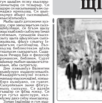
Четег тафэм шагьэсэпс иныбжыкырылэс И-Г-и кырыбэ.

Четег тафэм шагьэсэпс иныбжыкырылэс И-Г-и кырыбэ. Шынадым шыкыбэ шыкыбэ дэжэри зэхуушэ.